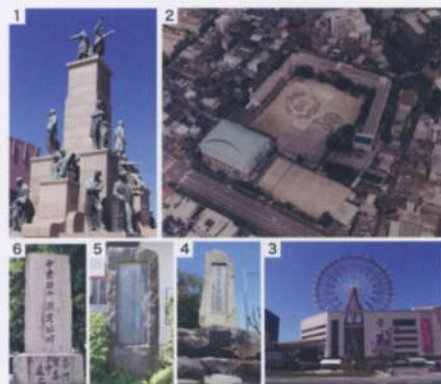
1 鹿児島中央駅前に立つ「若き薩摩の群像」、2 学校周辺の様子（写真は2006年の創立100周年記念の時のもの）3 鹿児島中央駅。学校から徒歩10分と便利です。4 「甲南」という名称の由来ともなった三方限。その出身者を示した「三方限出身名士顕彰碑」5 「ぶどう王」こと長澤藤生誕の地は正門からすぐの場所にあります。6 校内に立つ幕末の志士・中原新介の生誕地を示した「中原新介顕宅址碑」。

また、交通の要所・JR 鹿児島中央駅や市電（路面電車）、高速道路から近く通学に大変便利な場所です。この地域はますますの発展が期待されています。