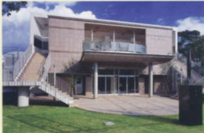
二甲記念館 (同窓会館)