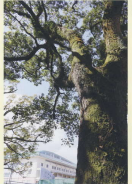
大クス (校木 樹齢100年)