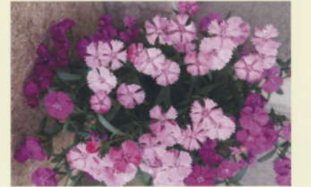
校章の花 なでしこ