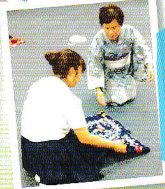
浴衣着付教室の風景(女子)