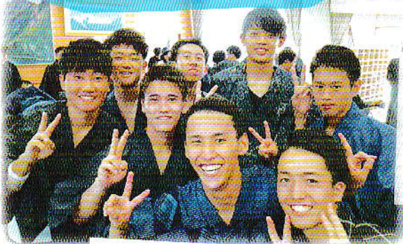
体育祭当日の風景