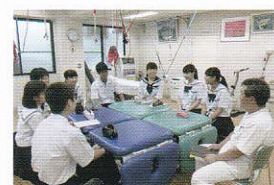
進路セミナー (キャリア教育)