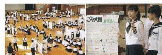
ポスター形式による課題研究発表 (大学教員による助言・指導)