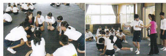
表現力研修 (外部講師による表現力向上プログラム)