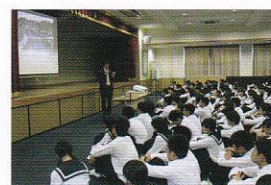
外部講師による大学レベル講義