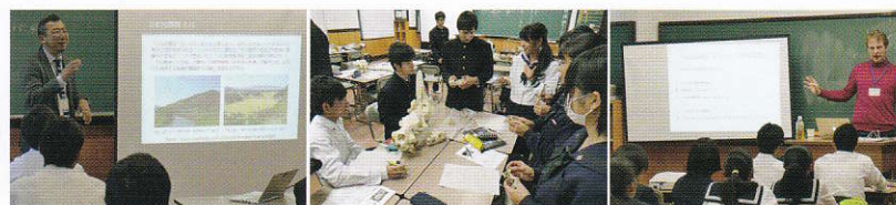
ブラッシュアップセミナー (大学教員による教養講座)