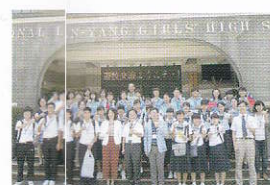
海外研修 (学び台湾)