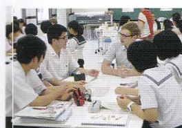
キックスタートセミナー