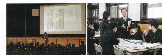
南日本新聞の記者による新聞書き方講座