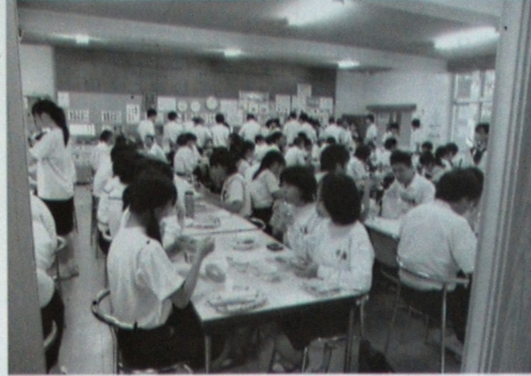
学食にも増税の影響はあるのでしょうか？

2014年4月1日、消費税率が5%から8%に引き上げられた。消費税率は、平成元年の導入時は、税率3%であったが、平成9年に5%に引き上げられた。それ以来の税率引き上げである。今回の引き上げで、これまでほとんど気に留めてこなかった「経済」が身近な問題に感じられるようになった。近い将来、日本経済の中心になる私たち自国の経済について知らなくてはならない。今回は「日本経済の今とこれから」と題して特集する。